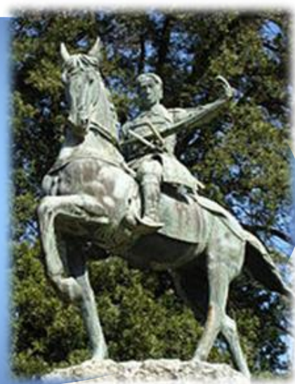
功山寺 高杉晋作の回天義挙の地