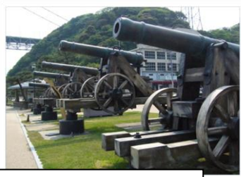
砲台跡 (みもすそ川公園)